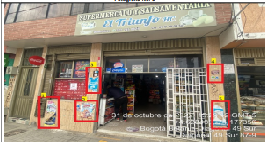
En la cual se evidencian cinco (5) elementos PEV, pertenecientes al establecimiento comercial SUPERMERCADO Y SALSAMENTARIA EL TRIUNFO HC, los cuales son adicionales al único elemento permitido por fachada de establecimiento.