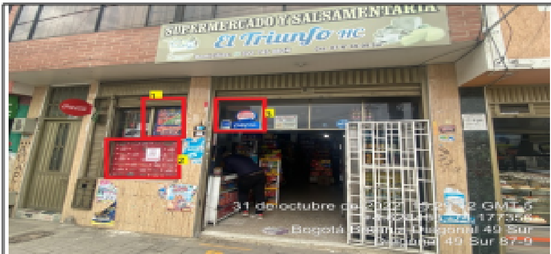
En la cual se evidencian tres (3) elementos PEV, pertenecientes al establecimiento comercial SUPERMERCADO Y SALSAMENTARIA EL TRIUNFO HC, los cuales se encuentran incorporados a las ventanas de la edificación y son adicionales al único elemento permitido por fachada de establecimiento.