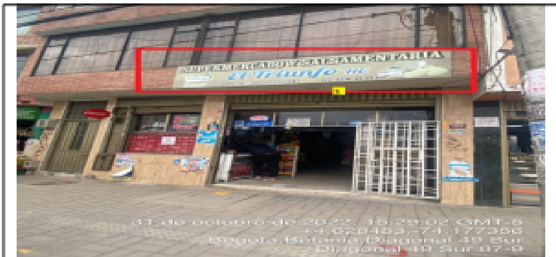
En la cual se evidencia un (1) elemento tipo aviso en fachada ubicado en antepié de segundo piso perteneciente al establecimiento comercial SUPERMERCADO Y SALSAMENTARIA EL TRIUNFO HC , al cual al momento de la visita se encontraba instalado sin el registro ante la SDA.