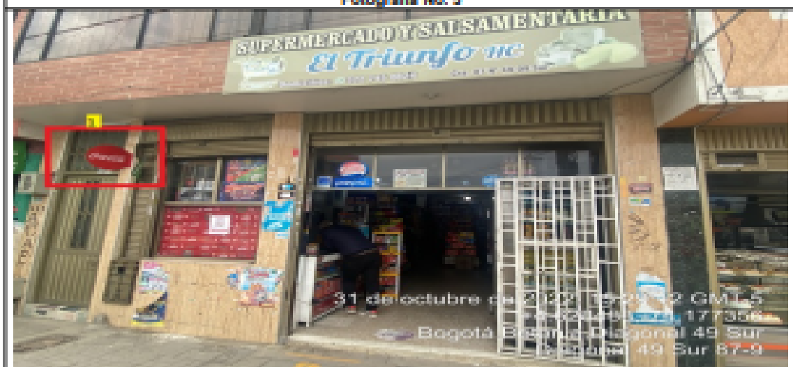
En la cual se evidencia un (1) elemento PEV, perteneciente al establecimiento comercial SUPERMERCADO Y SALSAMENTARIA EL TRIUNFO HC , al cual se encuentra volado de la fachada y es adicional al único elemento permitido por fachada de establecimiento.